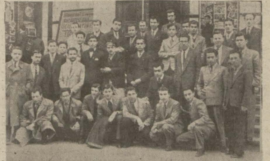
Yüksek tahsil Talebe Yurdunun erkekler kısmındaki talebelerden bir grup