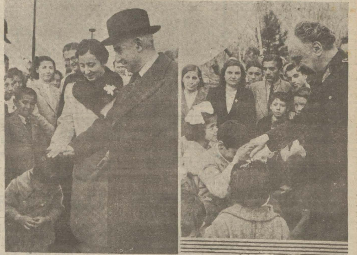
Milli Şef Çocuk bayramı münasebetile kendilerini ziyaret eden yavrulara iltifat ederlerken; diğer resim Mareşalimizi yavrular arasında gösteriyor